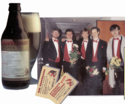
1994 keväällä Hummeripojat järjestivät Uudella Oopperatalolla parodiakonsertin "Iltta oopperassa".

Teksti: Ilkka Aaltonen