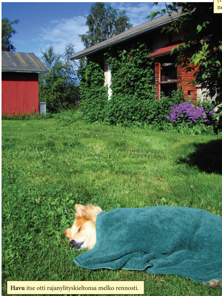
Havu itse otti rajanylityskieltonsa melko rennosti.

Heli ja Havu istuivat kiltisti kyydissä koko matkan – ja taisivatpa itsekin pitää maisemista. (Havu tosin piti jättää Ivaloon hoitoon, kun sen passi ei tainnut olla ihan kunnossa). Lintuja laskettiin taas, ja teltassa yövyttiin.