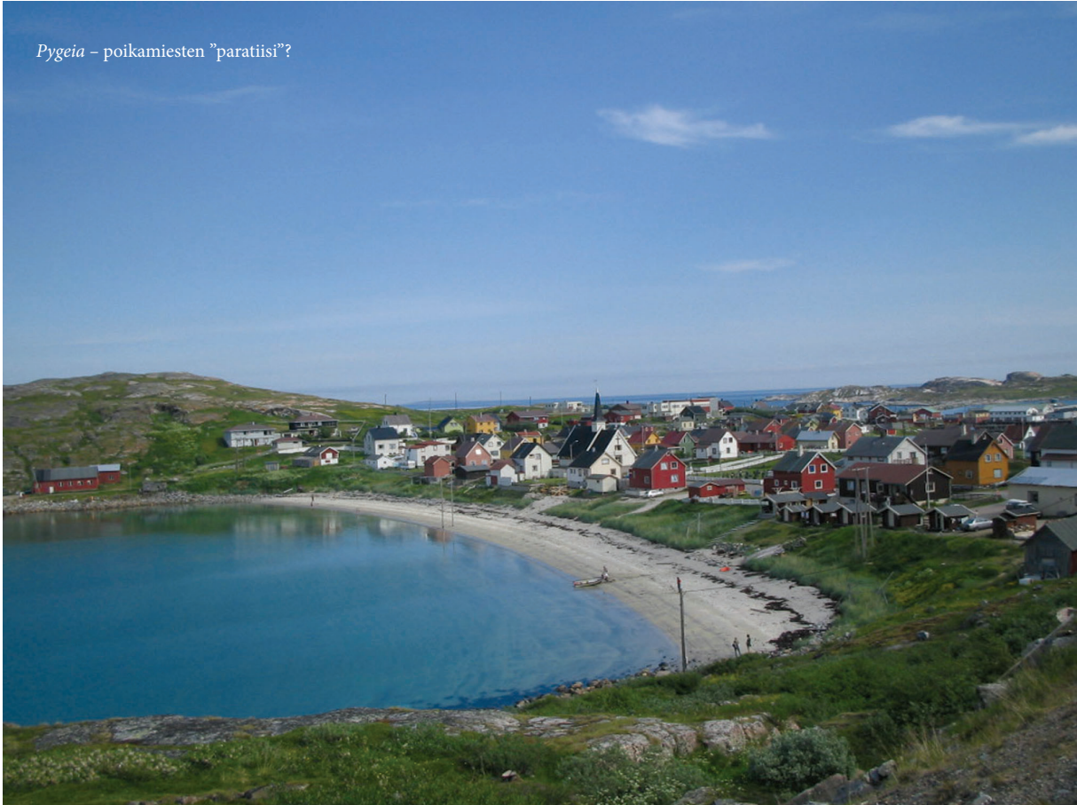
Pygeia – poikamiesten ”paratiisi”?

Päätepyssä Kirkkoniemi oli eriskummallinen kaupunki. Todella kaukana kaikesta, matkaa Norjan eteläkärkeen lähes 2000 km! Missään muussa Euroopan maassa ei taida olla vastaavia ”sisäetäisyyksiä”. Eristäytyneisyys näkyi valitettavasti myös hinnoissa: mm. oluttuoppi maksoi melkein kymmenen euroa, makkaraperunat kioskilta toisen kympin ja hotellihuone jotain tähtitieteellistä!