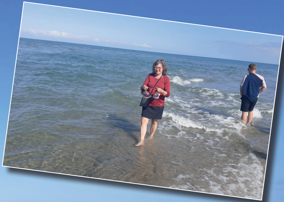
Näin astutaan merestä toiseen!