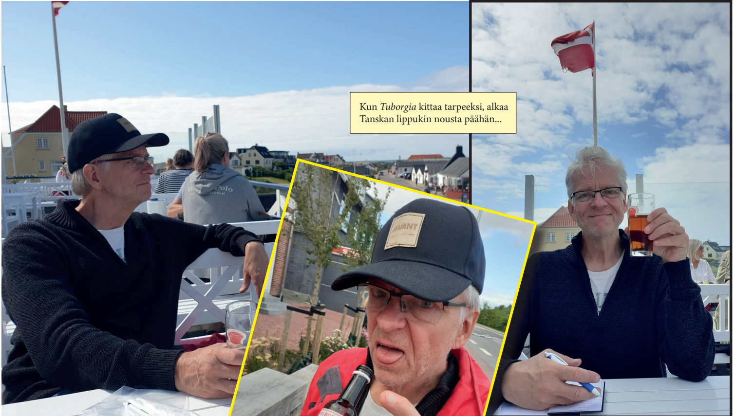
Kun Tuborgia kittaa tarpeeksi, alkaa Tanskan lippukin nousta päähän...