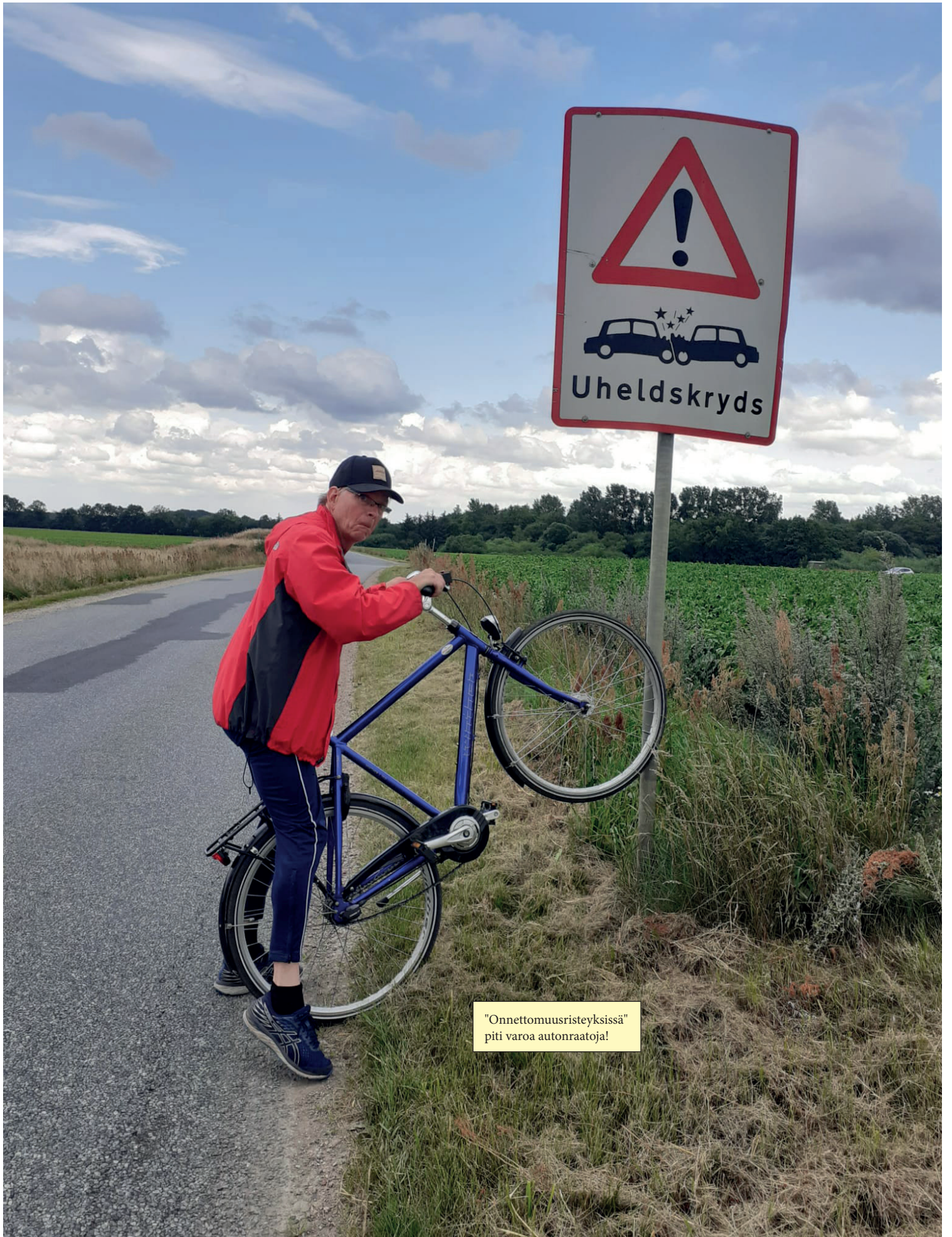
"Onnettomuusristeyksissä" piti varoa autonraatoja!