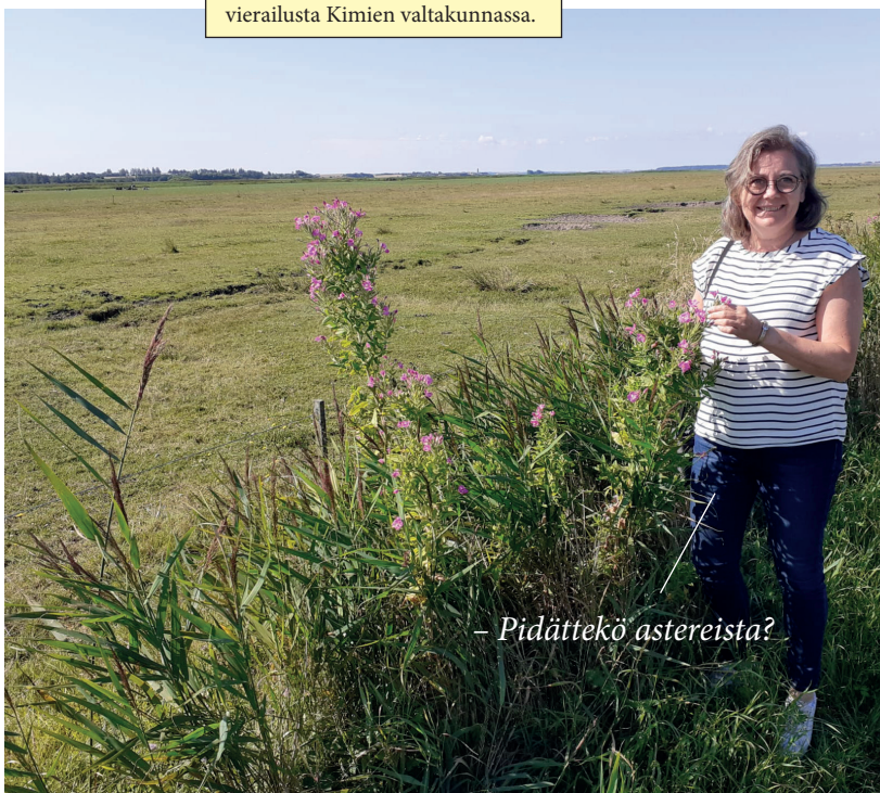
– Pidätkö astereista?