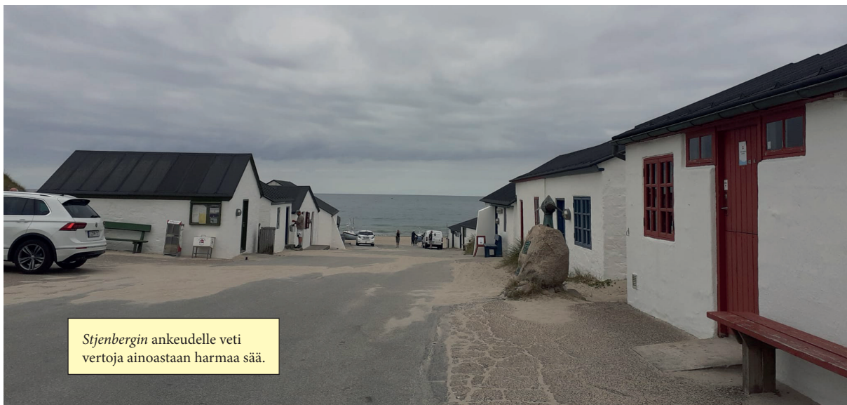
Stenbjergin ankeudelle veti vertoja ainoastaan harmaa sää.