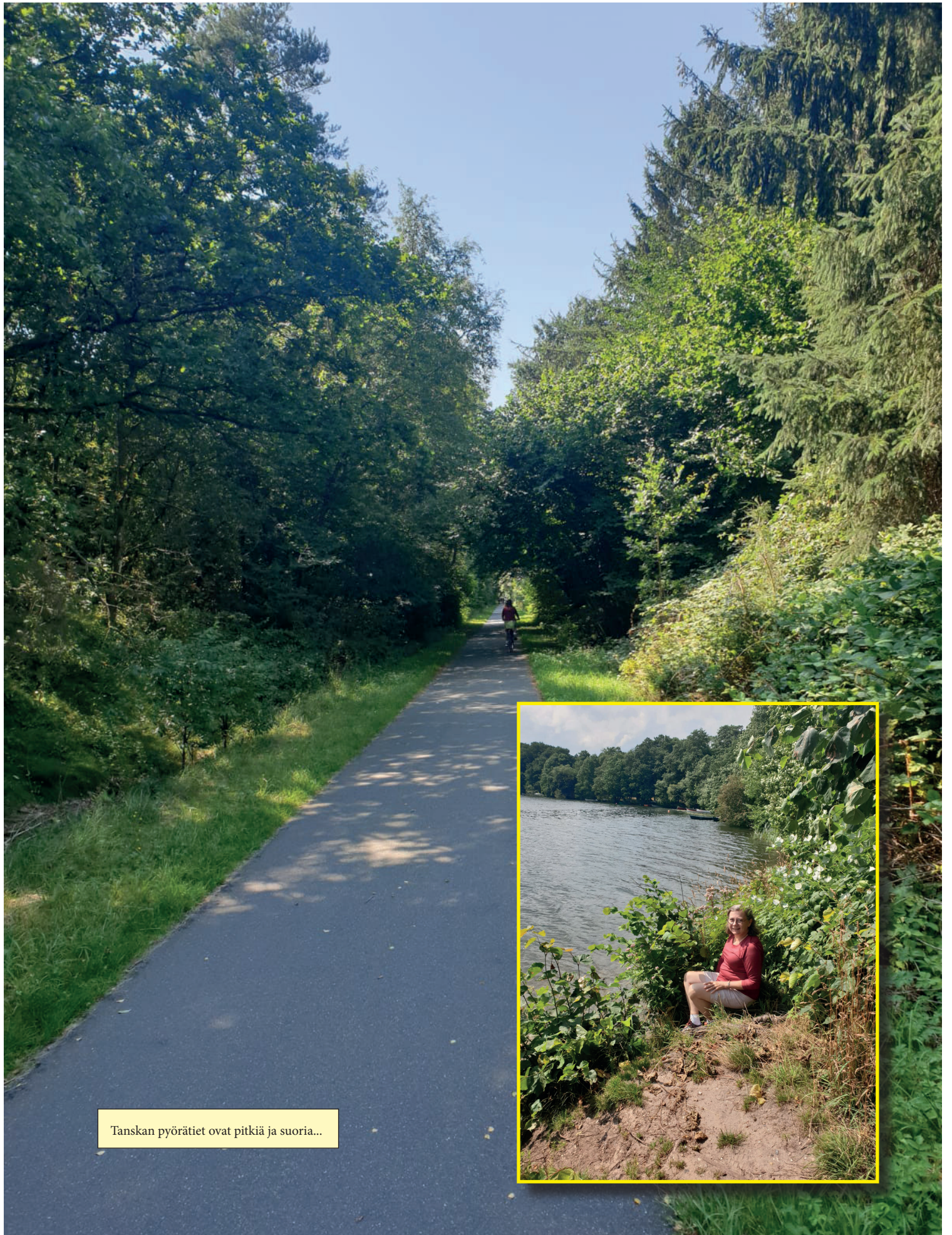
Tanskan pyörätiet ovat pitkiä ja suorita...