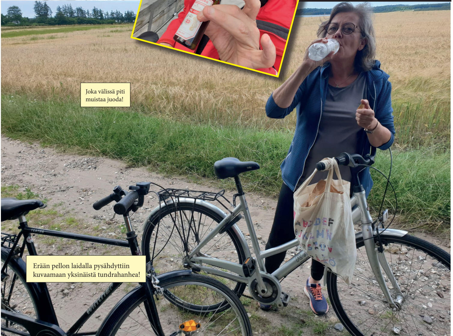
Joka välissä piti muistaa juoda!