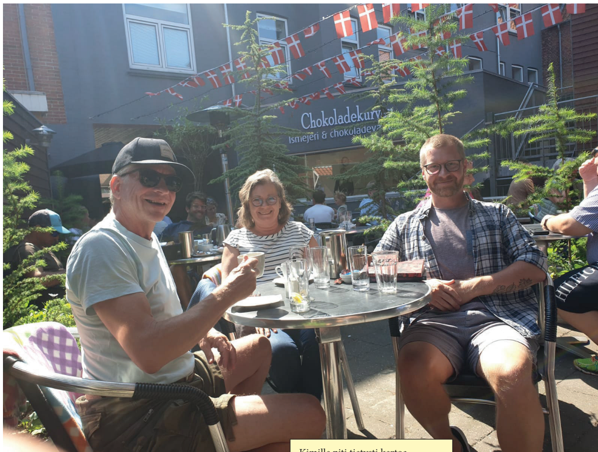
Kimille piti tietysti kertoa vierailusta Kimien valtakunnassa.