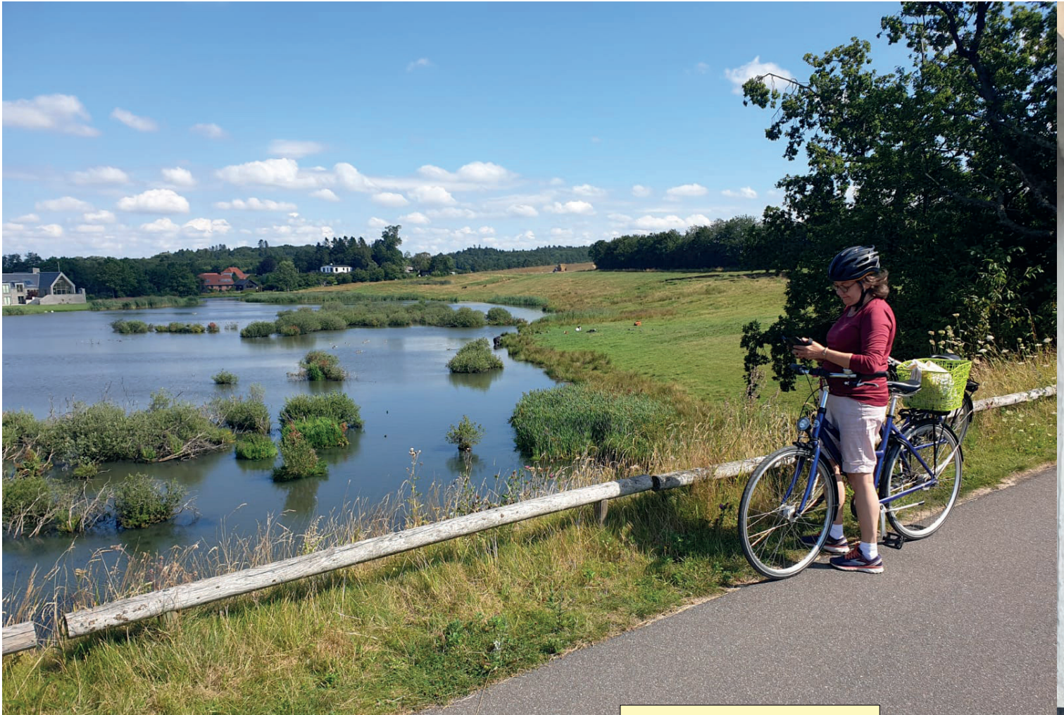
- Ei juurikaan mätää Tanskanmaalla...?