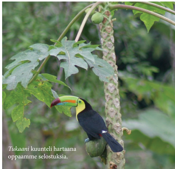
Tukaani kuunteli hartaana oppaamme selostuksia.

- Mitenkö säädellään vauhtia? Pidätte vasemmalla kädellä kiinni ripustinköydestä. Oikea käsi nostetaan pään yläpuolelle, kevyesti vaijerin päälle! Käyttä vaijeria vasten painamalla vauhtia voi hidastaa, ettei teistä tule lättöjä, kun puu tulee vastaan. Jottei kädestä lähtisi nahka, on yhtiomme varannut käyttöönnne tällaisia erikoishanskoja, joiden hahloon vaijeri tulee sijoittaa.