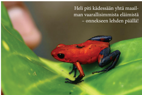
Heli piti kädessään yhtä maailman vaarallisimmista eläimistä – onnekseen lehden päällä!

Sakuilla oli mittaa runsaan sentin verran, kaksi oli kirkkaanpunaisia ja mustatäpläisiä, kolmas oranssi (Vasta Suomessa nähtiin TV-dokumentti maailman myrkyllisimmistä eläimistä: nämä sammakot jättävät kirkkaasti taakseen mm. kobran ja mustamamban ).