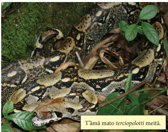
Tämä mato terciopelotti meitä.