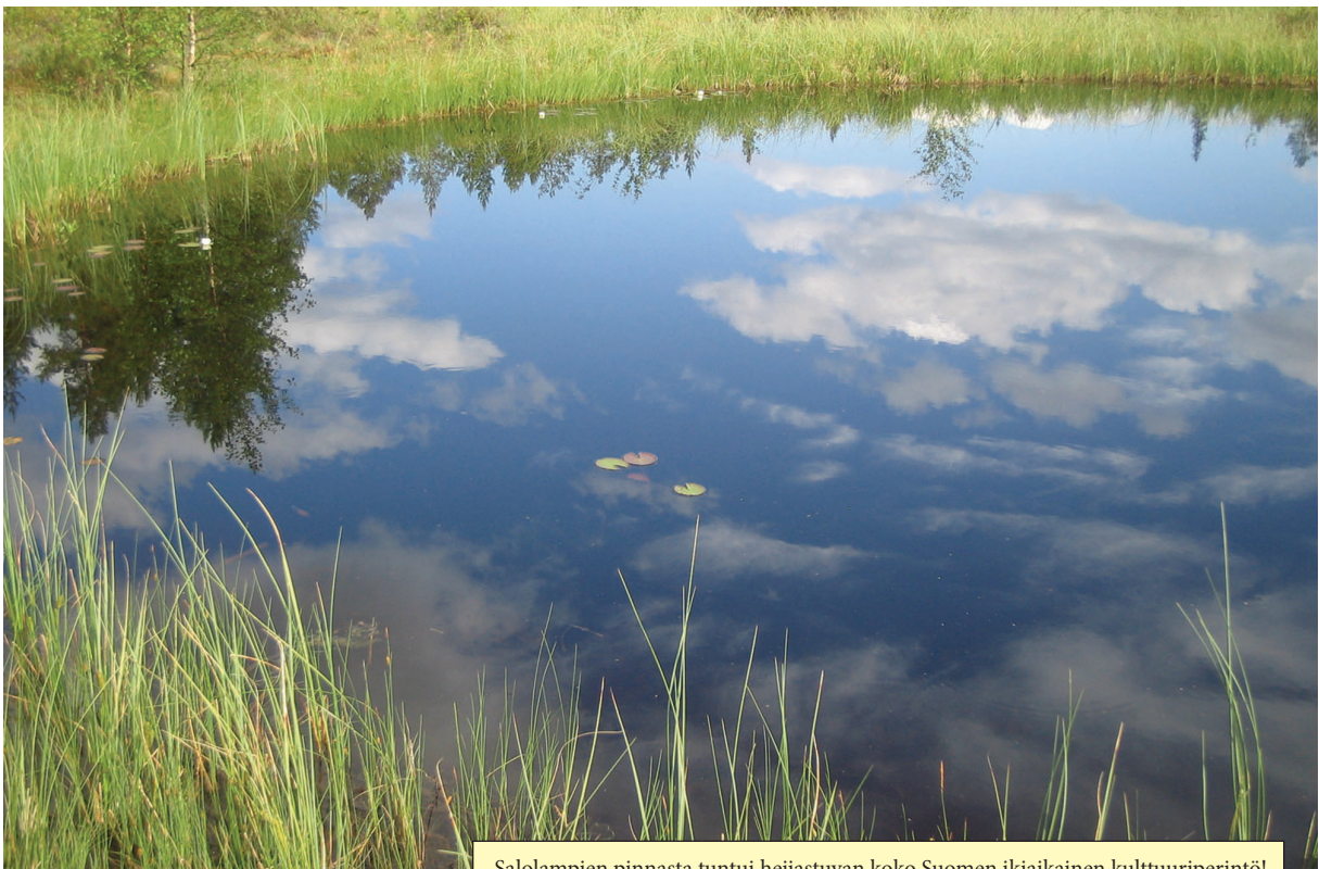
Salolampien pinnasta tuntui heijastuvan koko Suomen ikiaikainen kulttuuriperintö!

Pian löysimme pitkospuutkin. Vetelimme Kärki-He-lismaan hilpeää rallia " On suo, pitkospuut... " Kostean korpitaipaleen päätteeksi alkoi vihdoin kuulua lupavaa kohinaa: Köynäskoski siellä pauhasi kahden järven yhtymäkohdassa, jossa lenteli lapintiiroja, telkkiä ja yksi valkoviklokin!