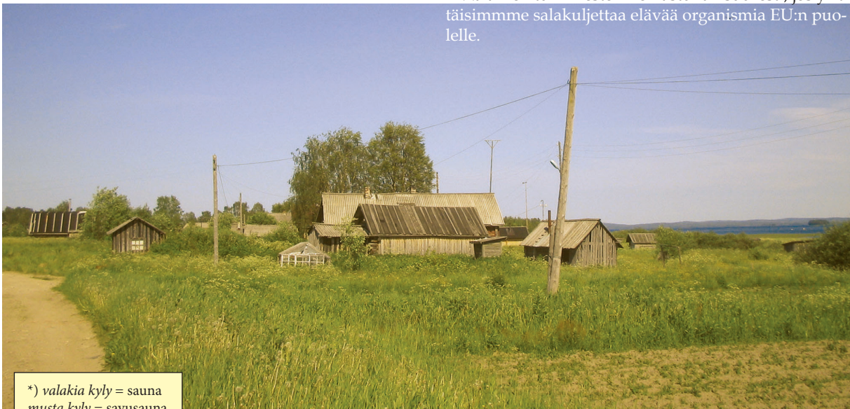
*) valakia kylä = sauna musta kylä = savusauna

Puikkelehdimme hiljaisten tönöjen ja traktorinhylykjen lomitse rantaan. Pensaiissa tirsskutti vihervarpusia. Välillä jouduimme kahlaamaan puolireiteen asti ulottuvassa kurjenpolvihetteikössä. Järvellä lipui yksinäinen kuikka . Näkymien kauneus oli salvata hengen!