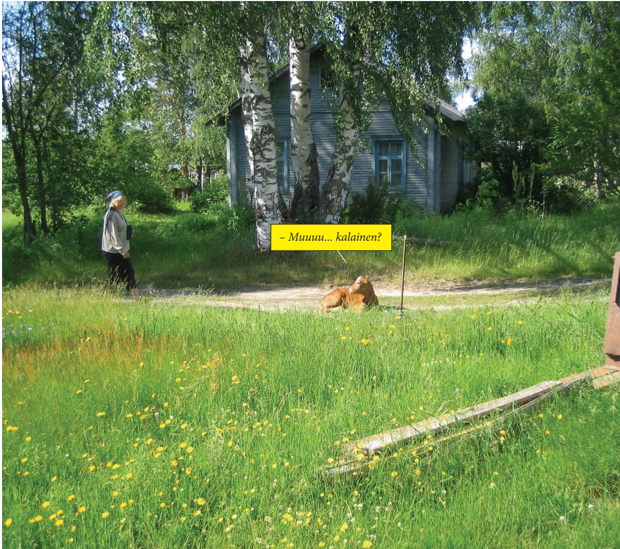
- Muuuuu... kalainen?