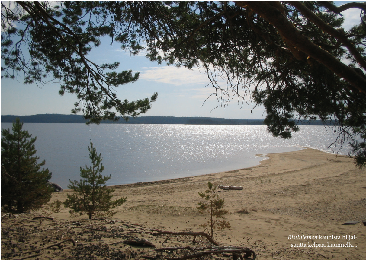
Ristiniemen kaunista hiljaisuutta kelpasi kuunnella...