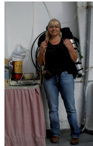
Teksti ja kuvat: Heli Naskali

Voliones-kylän risteyksessä käännyin suoraan alas ja jatkoin iloisin mielin kohti ison tien risteystä. Pyhä Antonius oli huolehtinut hyvin vieraastaan. Ehtisin hyvin Amarin bussiin ja pääsisin illaksi Rethymnooniin, mukavaan pikku kattohuoneeseen ja kuumaan kylpyyn!